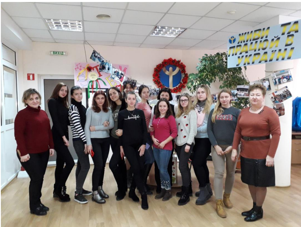
На фото: настрій заходу – святковий!