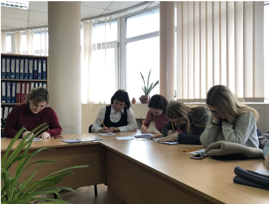
На фото: анкетування з метою самооцінювання триває.